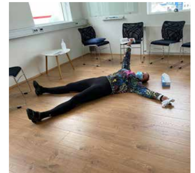
Ráðgjafi sýnir fjarlægð og sóttvarnir.

** Í júlí var lokað í þrjár vikur vegna sumarleyfa